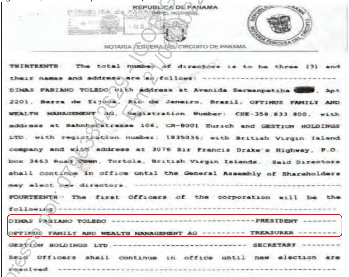
Figura 6 – Papel notarial da Opala Work Invest, no Panamá.